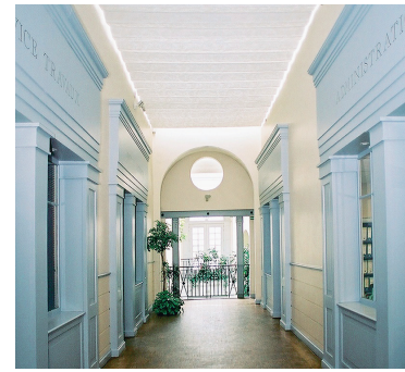
SIÈGE SOCIAL SOGINORPA 62 Bruay-La-Buissière