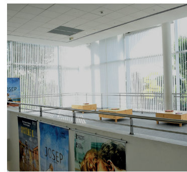
THÉÂTRE 11 Narbonne