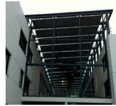
LYCÉE BUFFON 92 Levallois