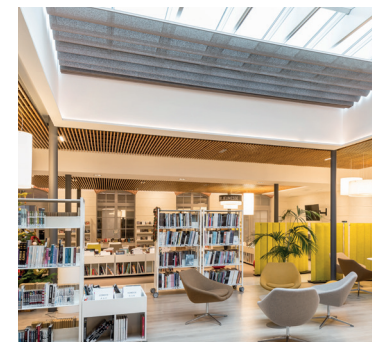
MÉDIATHÈQUE LE NUAGE BLEU TOMI UNGERER 91 Brunoy