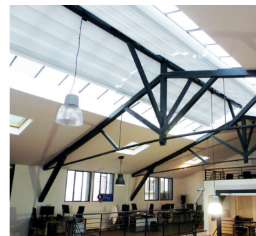
SOCIÉTÉ INFORMATIQUE 75 Paris