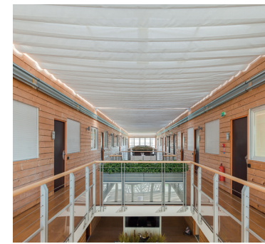
FÉDÉRATION FRANÇAISE DU BÂTIMENT 45 Olivet