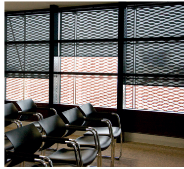
TOUR ELITHIS 21 Dijon