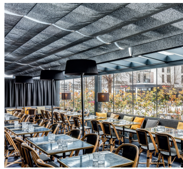
RESTAURANT GRAZIELLA 77 Montévrain