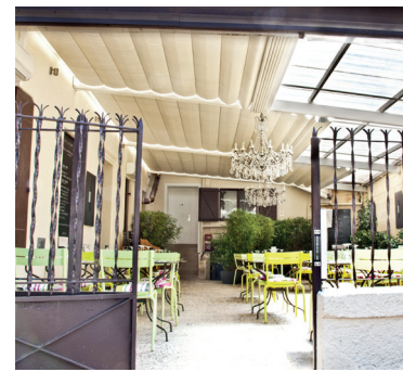
HÔTEL RESTAURANT LE SAINT-JAMES 33 Bouliac