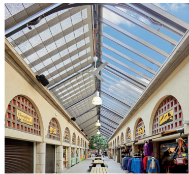
HALLE DE DINAN 22 Dinan